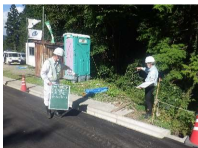
社内安全パトロール(9/30)