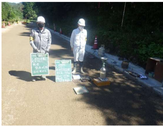
密度試験による締固め確認(監督員立会)