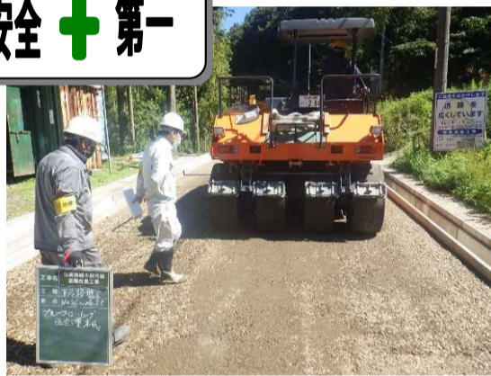
路盤碎石(監督員立会)