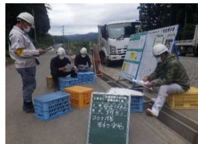
現場での安全訓練