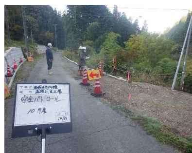
社内安全パトロール